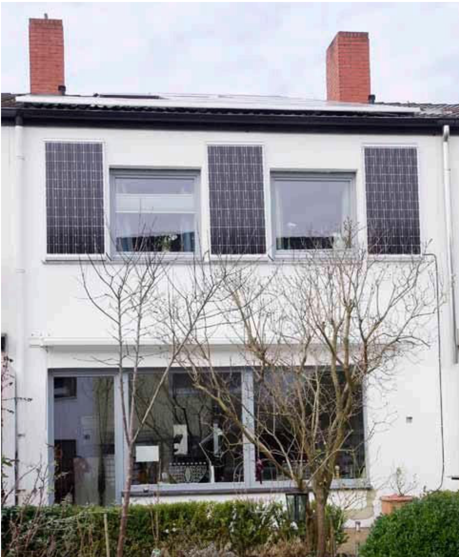
An der Südfassade nutzt Familie Goltsche sogenannte Plug-in-Module für die Steckdose.