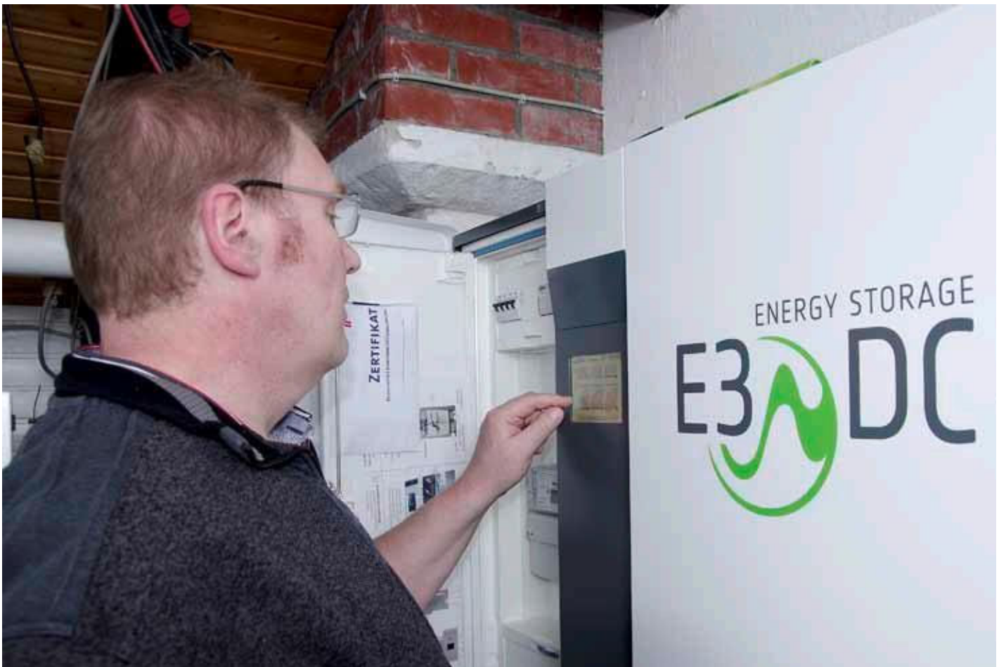
Der Autor bei der Inbetriebnahme des Hauskraftwerks von E3/DC.

der Beratung vermittelt: Am Beispiel E3/DC lässt sich belegen, dass Wettbewerbssysteme die Batterie am Abend mit deutlich größeren Verlusten (30 bis 40 Prozent) steuern, weil die zugehörigen Batteriewandler der Bleitechnik entstammen.