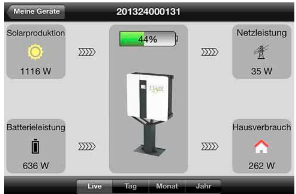
Anzeige in Echtzeit der Momentanwerte und Betriebszustände vom Hauskraftwerk.

Um die Installation abzuschließen, wurde der Hausanschluss hinter dem Stromzähler abgetrennt. Anschließend wurde ein Kabel (5 mal 16 Quadratmillimeter) vom Zähler zum Gerät gezogen, durch das Gerät durchgeschliffen und direkt wieder zurück zum Hausanschluss geführt. Der Clou: Sobald die Module vom Dach Leistung liefern, kann das Hauskraftwerk seine Arbeit aufnehmen. Die intelligente Steuereinheit des Gerätes registriert und steuert ab diesem Zeitpunkt sämtliche Energieströme des Hauses. Liefert die Solaranlage Leistung, wird diese zunächst genutzt, um die aktuellen Verbräuche im Haushalt auszugleichen. Überschüssiger